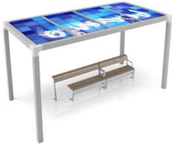
Pergola con banco