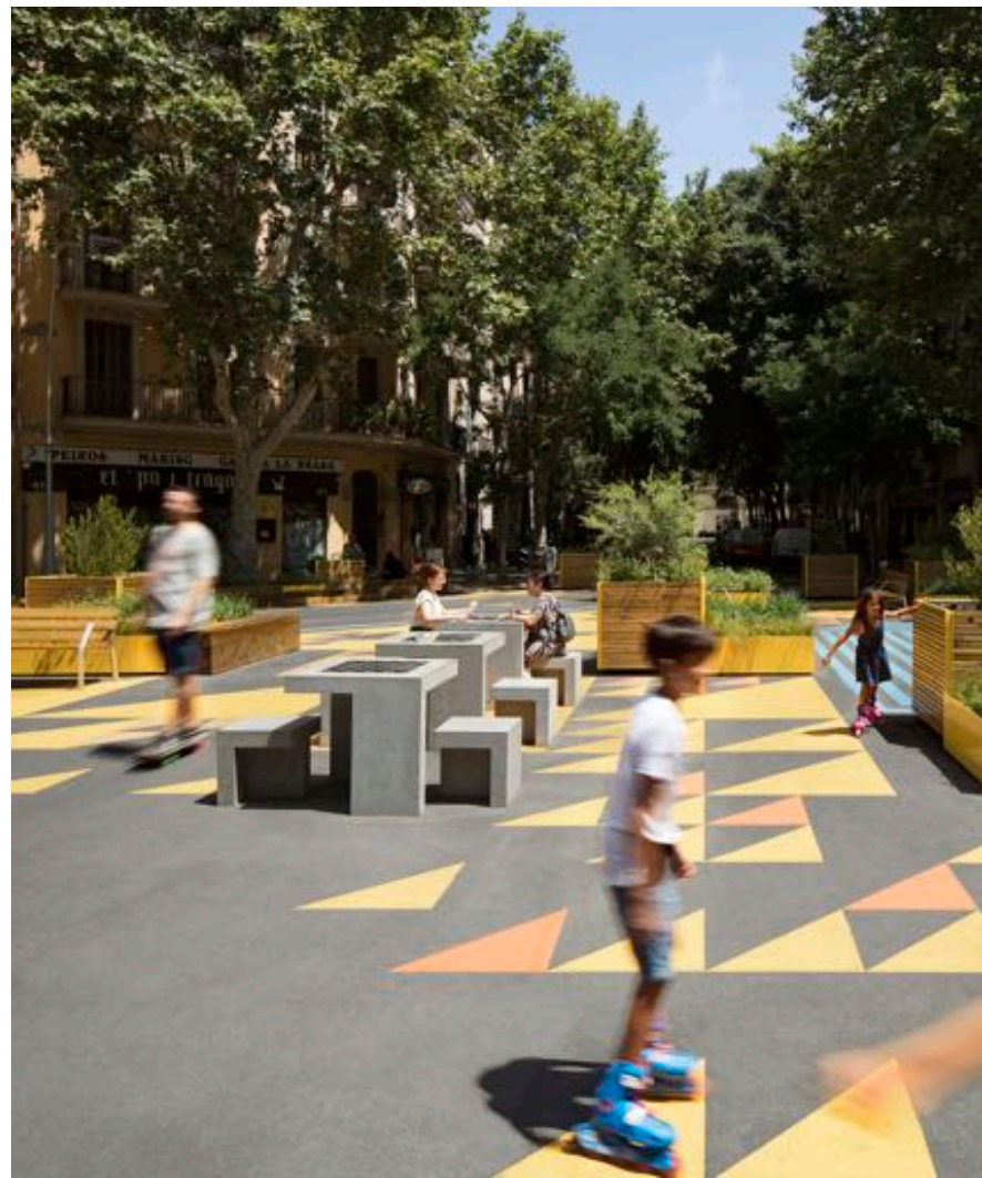
Esku hartutako eremuaren adibidea