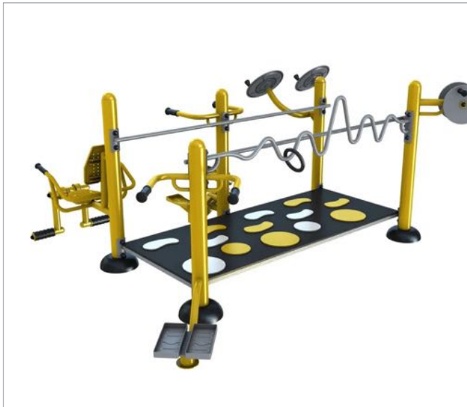
Ejercicios 3ra edad

En caso de que el proyecto salga adelante se podrán proponer otras alternativas siguiendo la misma filosofía de la propuesta.